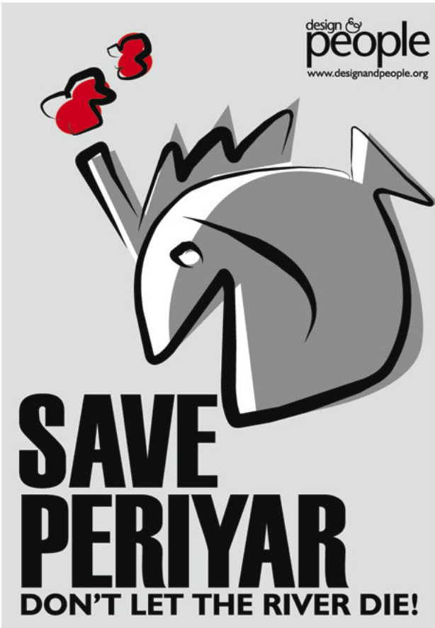
Save Periyar / August 2003