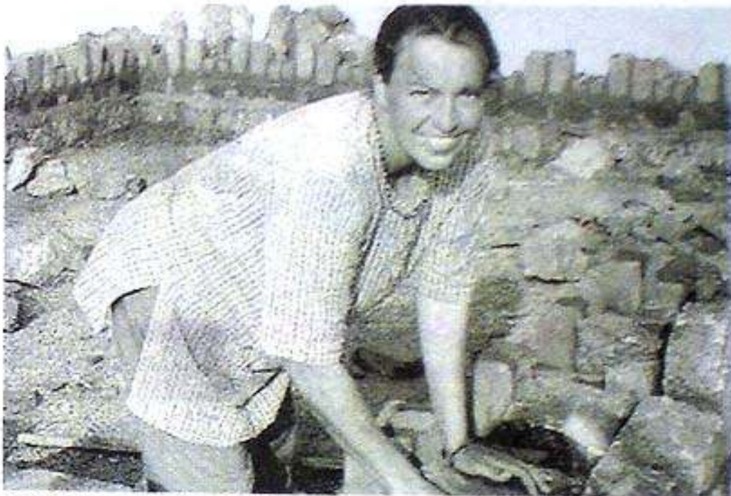
അൽകെ കോശ് മൺവീടു നിർമ്മാണത്തിൽ.